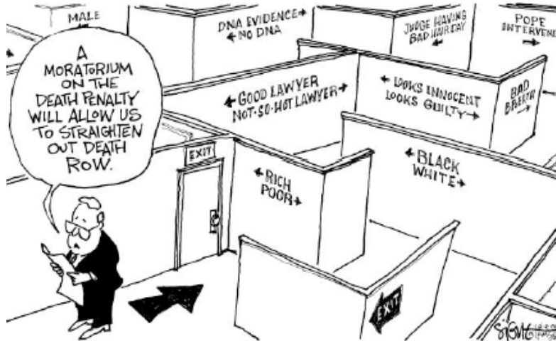
Signe Wilkinson Philadelphia Daily News , 2000 © S. Wilkinson - Windows on Death Row, Globe Cartoon, 2016