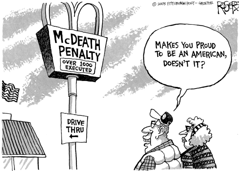
Rob Rogers Pittsburgh Post-Gazette © R. Rogers - Windows on Death Row, Globe Cartoon,