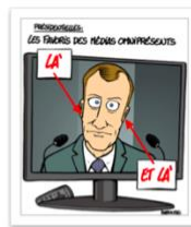
● Babouse_Charlie Hebdo.jpg