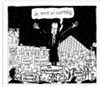
● Kroll_Le Soir_mai 2017.jpg