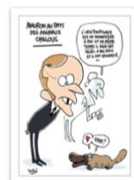
● Soulcié_Urtikan_mai 2018.png