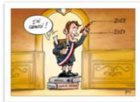
● Alex-La Liberté-mai 2018.jpg