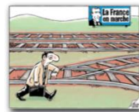
● Bénédicte_24Heures-mai 2018.jpg