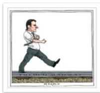
● Bertrams_Courrier International_avril 2018.jpg