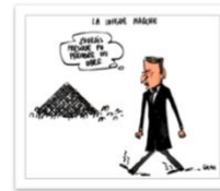
● Lara_L'Obs_mai 2017.jpg