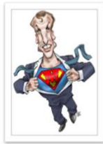
● Glez_Cartooning for Peace.jpg