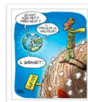
● Tabary_Hebdo Charente-Maritime_2017.jpg