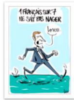
● Besse_juillet 2017.jpg