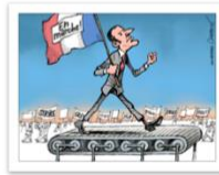
● Chappatte_Der Spiegel_avril 2018.jpg