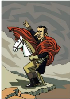
Affiche Desaln par Herrmann.jpg