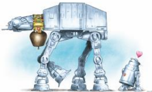
Valott, dessin inédit